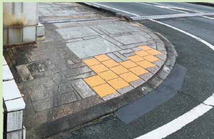
原野谷川の静橋(段差舗装)

公明党のネットワーク力を活かして県議会議員に相談し、補修工事が決定し、施工されました。誰もが住みやすいまちづくりに取り組みます。