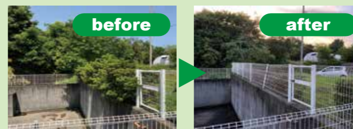
浅羽地区の整備された調整池

市民より調整池に伸びた木の相談を受け、市に伝え早急に対応していただきました。住みよい環境作りをしていきます。