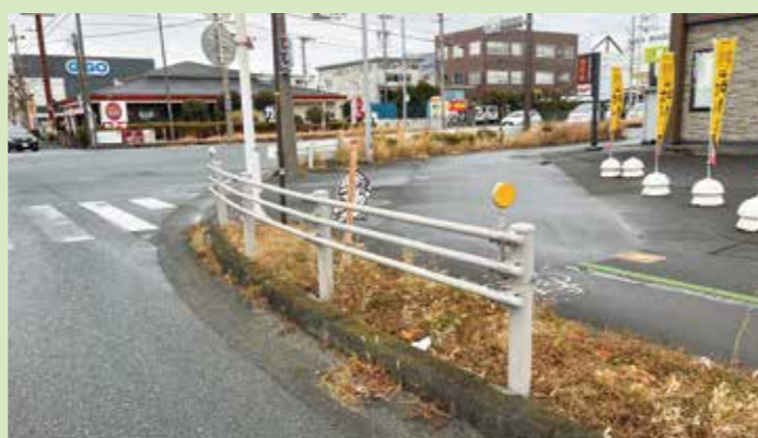
川井地区に設置されたガードレール