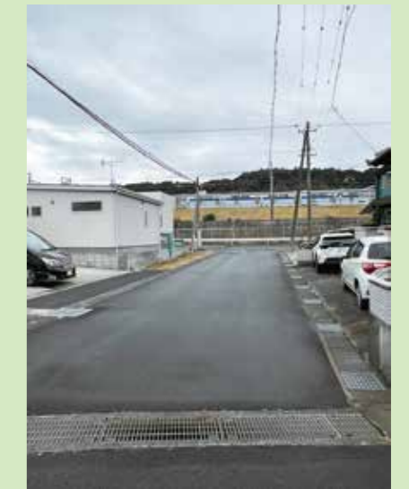
愛野地区の冠水対策