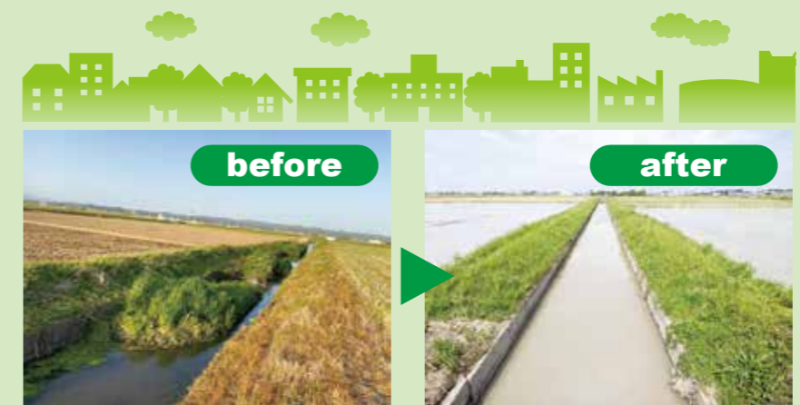
富里地区の用水路(土砂撤去)