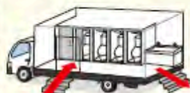
トイレトラックイメージ